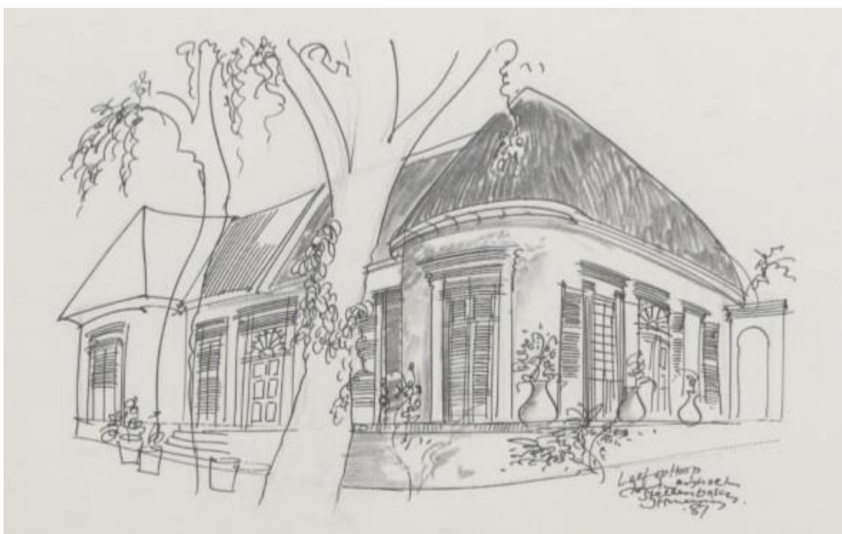
Leef op Hoop, Klein Gustrouw, Jonkershoek