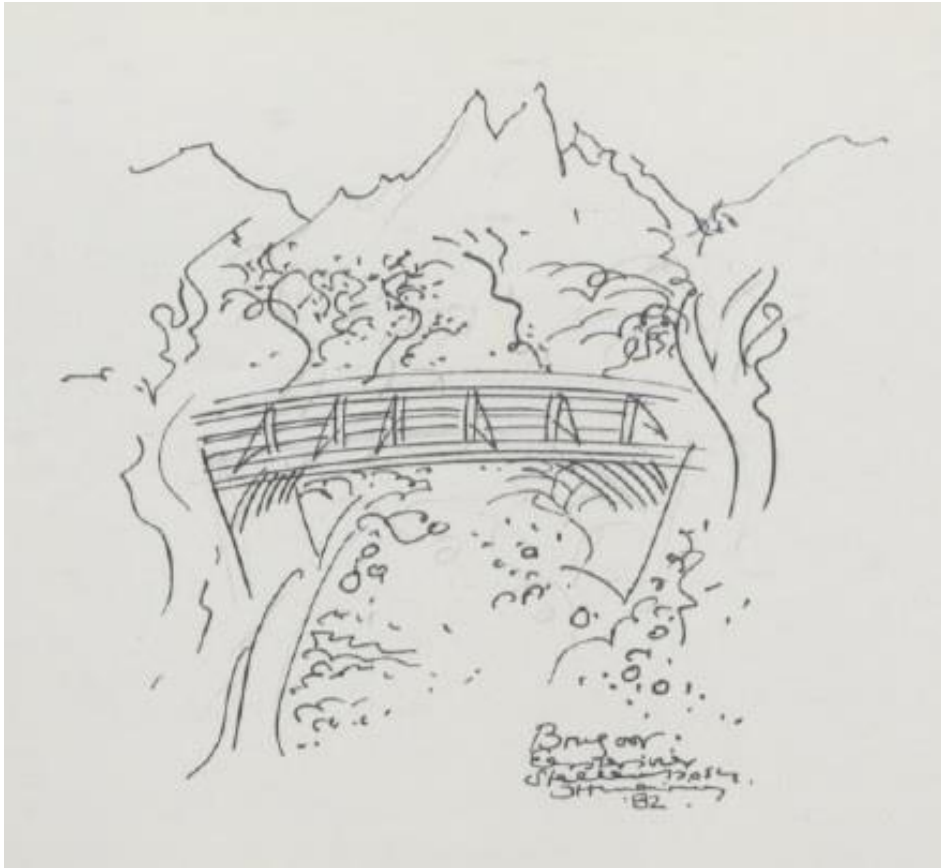
Brug oor Eersterivier