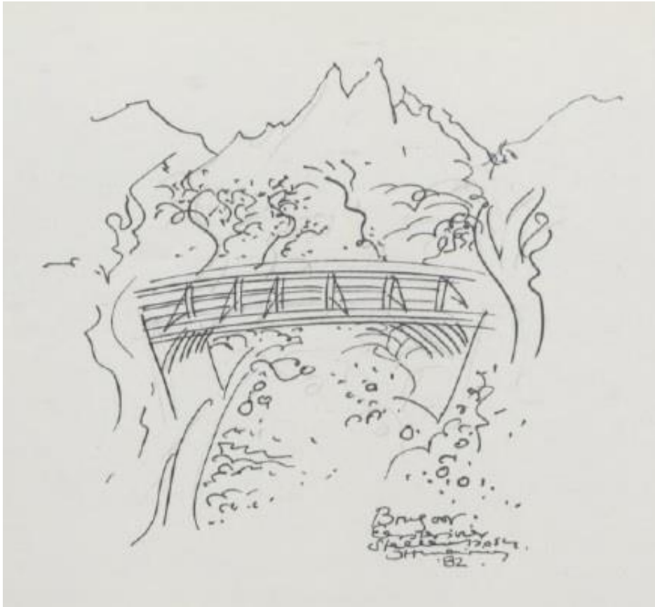
Brug oor Eersterivier